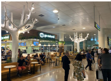
Фото місця зустрічі (1-й термінал аеропорту Барселони):

2-й термінал аеропорту Барселони — зустріч буде здійснюватися навпроти виходу із зони отримання багажу (зона очікування для водіїв), водій буде тримати в руках табличку з іменами туристів англійською мовою.